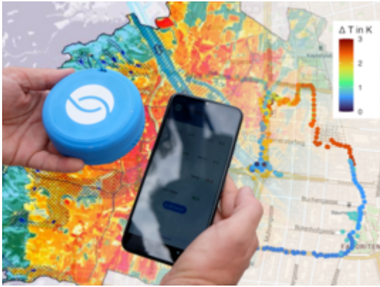
Integrierte Klimakarte